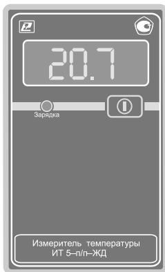
Рисунок 1 – Внешний вид измерителя температуры поверхности цифрового переносного ИТ 5–п/п–ЖД

5.4 Датчик температуры расположен с тыльной стороны измерителя.