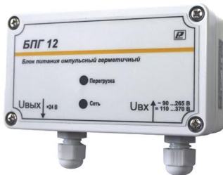
Рисунок 1 – Внешний вид блока питания импульсного герметичного БПГ 12

5.1 Подсоединение блока производить в соответствии с рисунком 1 и электрической схемой подключения (см. Приложение А).